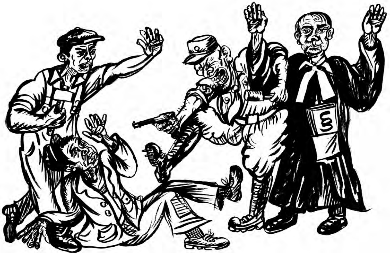
Rekonstruktion der Intervention kommunistischer Aktivisten auf einer NSDAP-Versammlung am 13. Januar 1930.